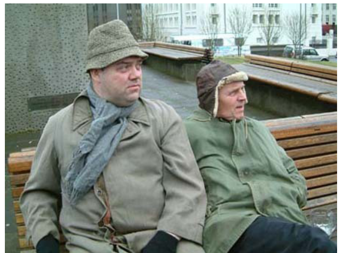
Dollý dulræna telur að Spaugstofan muni hætta á árinu 2012.